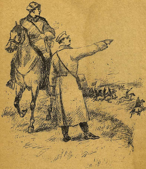
Товарищи Сталин и Ворошилов на фронте под Царицыным